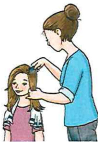
Die nassen Haare am 1., 5., 9. und 13. Tag auskämmen.