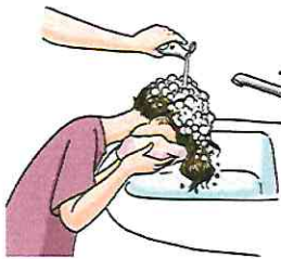
Haare mit der Lösung durchtränken