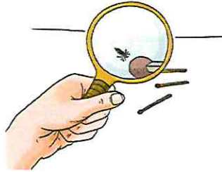
bei Befall mit Kopfläusen oder Nissen