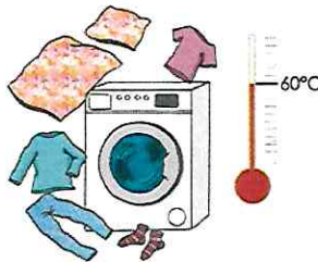
Wäsche waschen bei mindestens 60°C