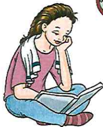
meistens 30 - 45 Minuten Einwirkzeit (unbedingt Packungsbeilage genau beachten)